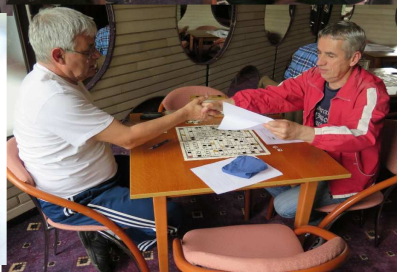
male sive stanice u punom pogonu