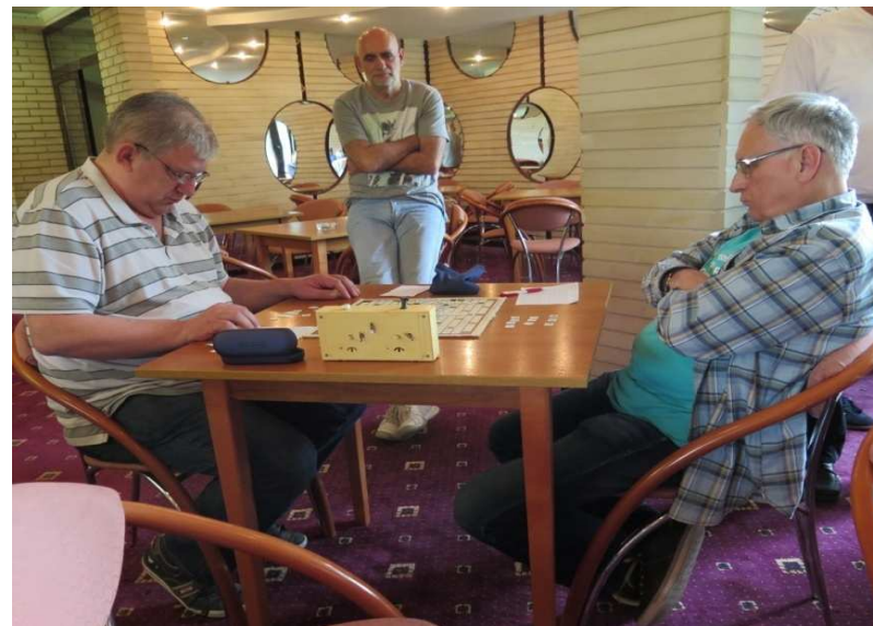
pobjednička trojka (psst, još to ne znaju)