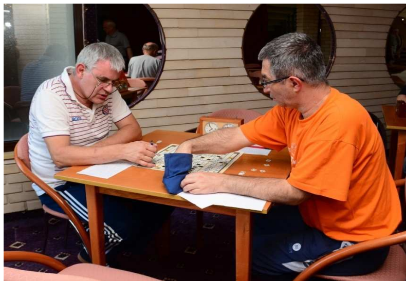
Boživran - EKK